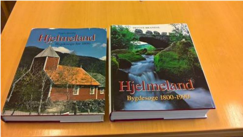
Bygdesoge 1 og 2 - ein kulturskatt i seg sjølv

Initiativet til denne planrevisjonen er kome i samband med midlar stilt til rådvelde av Riksantikvaren i 2014. Desse midla er i hovudsak brukt til ei gjennomgang av dei mest verdifulle bygga SEFRAK-registreringa. SEFRAK er ei registrering av bygg frå før 1900, delt i klasse A,B og C der A-bygga er dei med størst verdi., sjå eige avsnitt om dette.