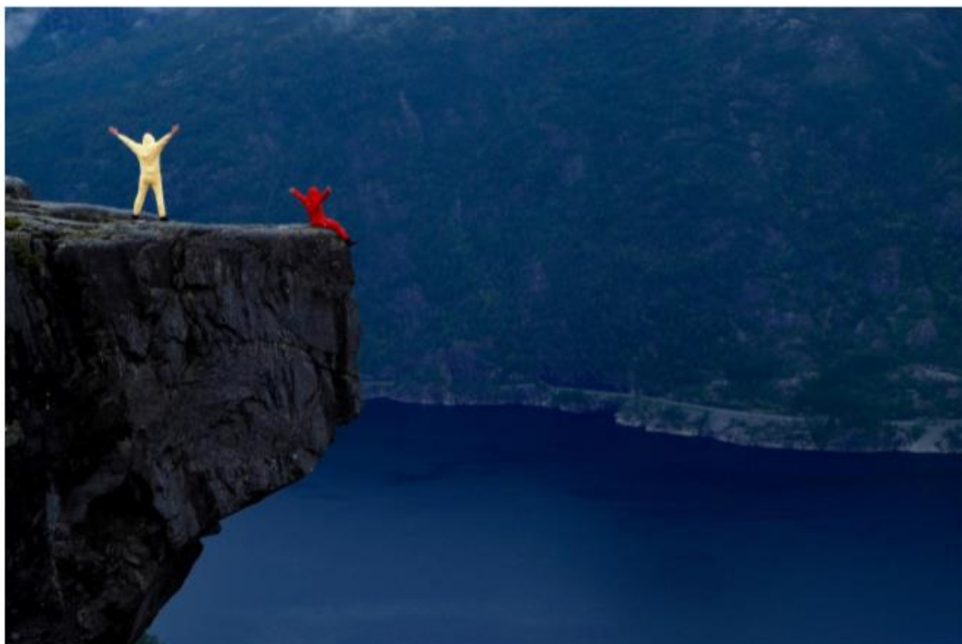
Skomakarnibbå foto Eldfinn Austigard

Stipulert utvikling rentekostnader i perioden, kilde: KBN finansportal