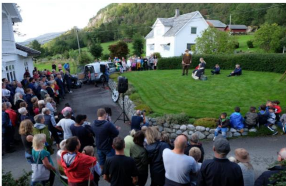
«Ring spelet» Sæbø.