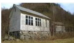
Det gamle skulehuset på Funningsland er eit SEFRAK-bygg

I tillegg til A-bygga er der drøyt 200 bygg i kategori B og ennå litt fleire i kategori C.