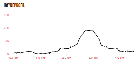
Høydekurven og kartet viser turen én vei. Totalt er turen ca. 9,2 km tur/retur.

Sommaren 2011 var kunstnarar frå Spania, Portugal og Noreg samla her i Hjelmeland. Dei laga då fem skulpturar som nå er plassert langs den vandreruta me har kalla ”Skulp-turen”. Vandreruta vil også vise deg verdas største jærstol og ei minnestøtte over falne i 2. verdskrig. På toppen av ”Hjelmen” vil du få nydeleg utsikt over Hjelmeland og innover i Ryfylkefjordane.