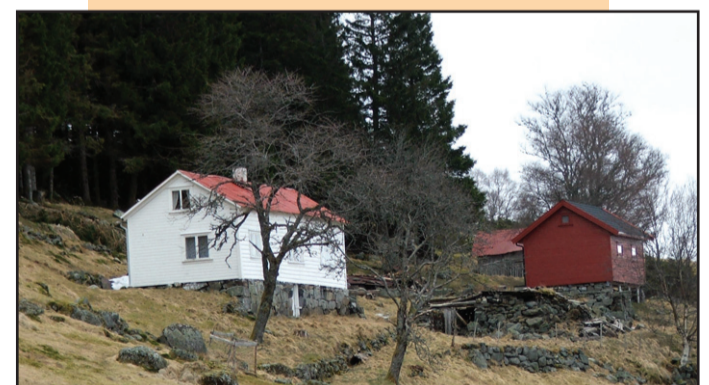
Indre Ramsfjell.