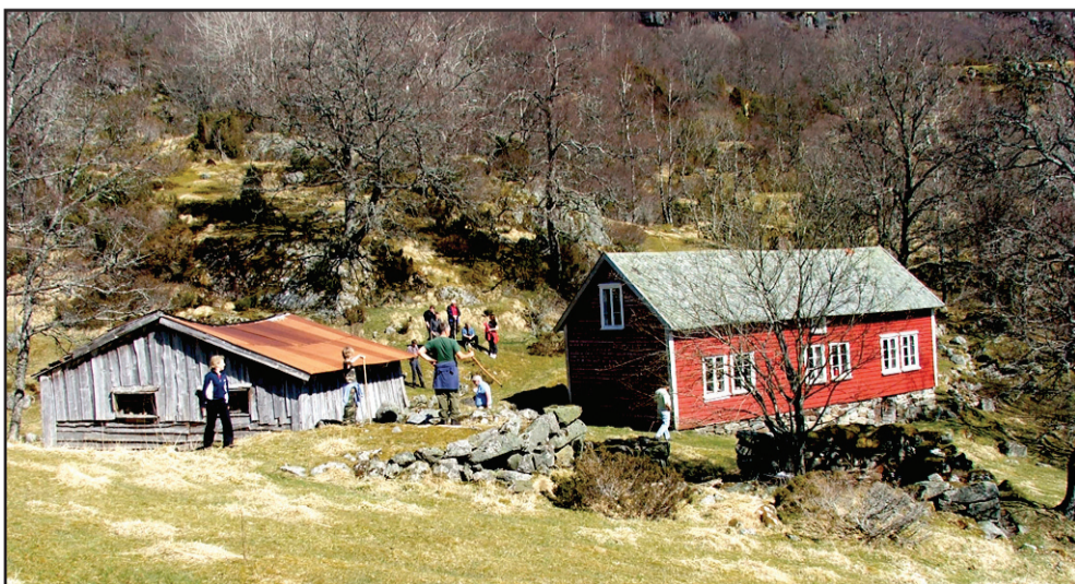
Ytre Ramsfjell.