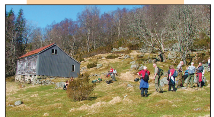
Midtre Ramsfjell.