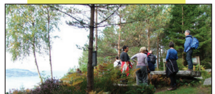
Rasteplassen på skogsstien.