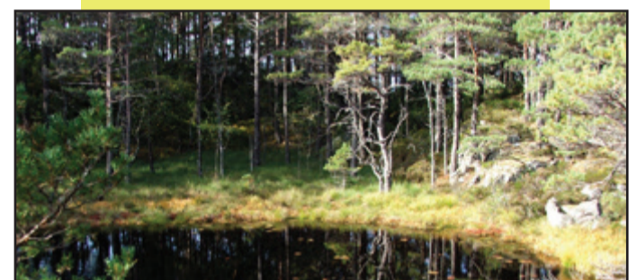
Idyllisk tjorn på Randåsen.