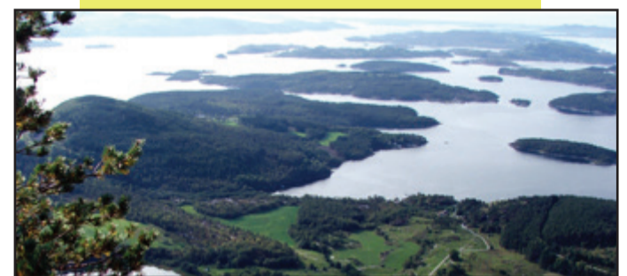
Utsyn mot Kådavågen, Halsnøy og Finnøy.