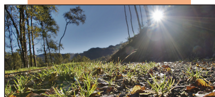
Haustsol på vegen til Ritland.