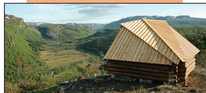
Gapahuken ovanfor Grøbane.