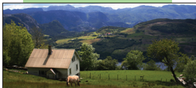
Frå Solbjør. Bratthetland i bakgrunnen.