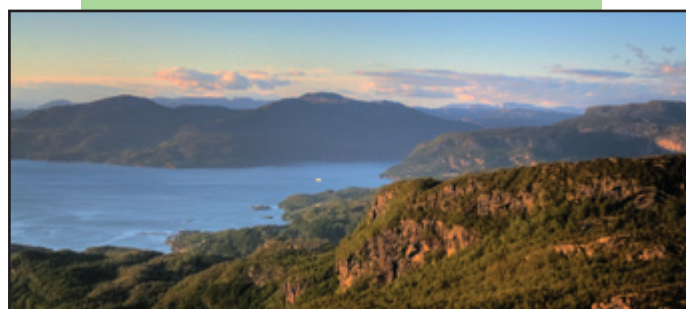
Utsikt mot Jøsneset og Jøsenfjorden.