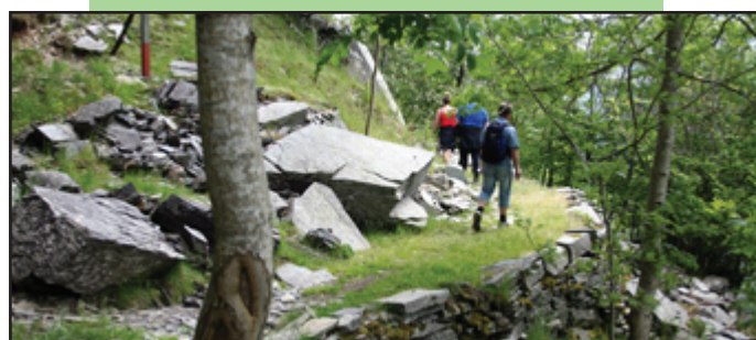
Støttemur med svært lokal skifer.