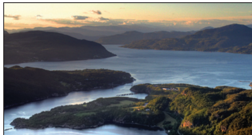
Utsikt frå Lauvåsen. Til venstre: Døvikneset, Randøy og Ombo. Til høgre ligg Jøsneset.

Frå begge endar kan denne turen leggjast opp som ein rundtur. Det er ein lett tur med variert landskap å sjå. Turen tar kring tre timar. Høgdeskilnad er rundt 150 meter.