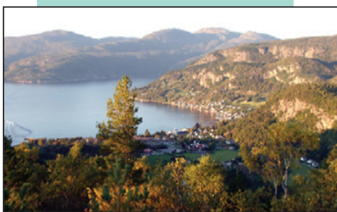
Utsikt frå Sandsåsen mot Hjelmelandsvågen og Jøsenfjorden.