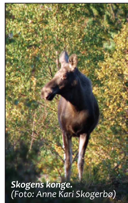
Skogens konge.

Kjør frå Hjelmeland sentrum mot Vormedalen. Avkjørsla er skilta til Husstøl og Bjødabu. Turen frå Pundsnes til Sandsåsen og ned att tek 1-2 timar. Ein tur frå Bjødabu til Pundsnes tek 3-4 timar. Turen eignar seg ikkje som rundløype eller tur/retur-løype. Høgdeskilnad: Ca. 350 m.