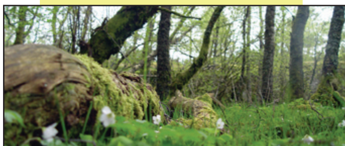
Kvitveisen blømer i skogen.