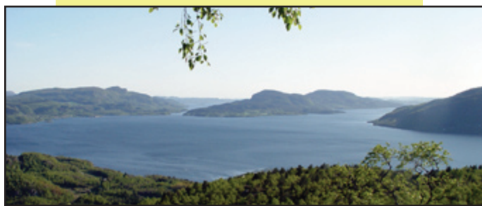
Utsikt frå Håvehammar.