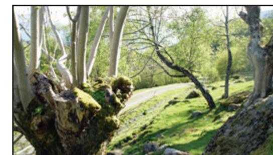
Mykje av turen går på skogsvegar.

Rundløypa om Håvehammar tek om lag to timar. Høgdeskilnaden er 250 meter.