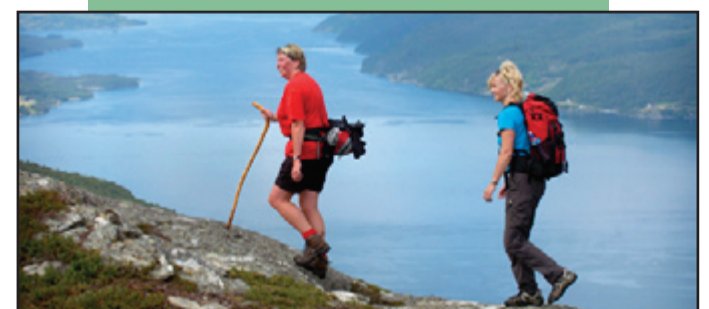
Fantastisk utsyn.