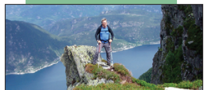
Karstykke 700 meter over fjorden.