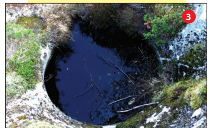
Jettegryte på Rygg