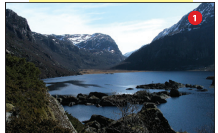
Viglesdalsvatnet mot Viglesdalsbøen