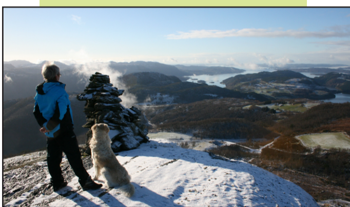
Utsikt mot Hetlandsbygda og Årdalsfjorden.

The track is a 1 - 1,5 hour walk, to Glos and back to Gjessefjell.